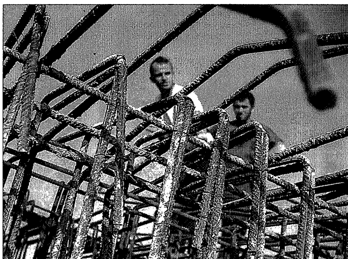
Empleados de la construcción, en los trabajos de forjado de una edificación.

Si se analizan los sectores de actividad al detalle, solo hay dos que prevén crear empleo a un año vista: el de información y comunicaciones (con un aumento previsto de sus plantillas de un 0,4% en